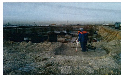
Насосная 1-го подъема. Ведутся работы по устройству каркаса монолитных фундаментов

Основными задачами на ближайший период по ТЭЦ-3 являются продолжение строительства железнодорожной станции, внешних инженерных сетей, объектов топливоподдачи, административных зданий и инженерных коммуникаций на площадке.