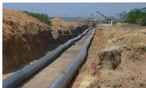
Технический водовод В-3. Ведутся работы по укладке трубопроводов

Для выполнения всех этих работ сегодня ведется обустройство стройплощадки (сборочная площадка, монтаж кранов, дороги, обеспечение освещения, обустройство складов).